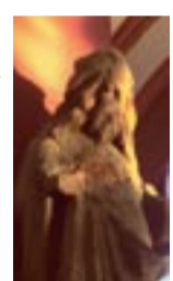
St. Jakobus, Stadtkirche Bayreuth

Wir beginnen an der evang. Stadtkirche und erreichen über Friedrichstraße, Jean-Paul-Platz, Ludwigstraße, Neues Schloss, Sternplatz, Opernstraße (Weltkulturerbe Markgräfliches Opernhaus), Albrecht-Dürer-Straße den Rotmainweg. Entlang des Roten Mains durchqueren wir das Gelände der Landesgartenschau 2016 und erreichen dann den ehem. eigenständigen Stadtteil St. Johannis (Markgrafenkirche von 1745. Gotische Wandmalereien aus dem 15. Jhd. im alten Chorraum. Taufengel mit muschelförmiger Taufschale. Pilgerstempel). Der Weg führt weiter durch den Landschaftspark Eremitage (Einkehrmöglichkeit, WC) zu den Ortsteilen Aichig und Grunau mit der evang. Magdalenenkirche (sechseckiger Rundbau von 1990). Nach der Gaststätte Schlehenberg (Hälfte der Etappe, Einkehrmöglichkeit) gelangen wir in den letzten unberührten Abschnitt des Rotmainwegs. Hinter dem Weiler Hagenohe führt ein Pfad entlang der Bahnlinie nach Creußen. Am Bahnhof vorbei gehen wir durch die Untere Vorstadt hoch zur evang. Kirche St. Jakobus, Pilgerstempel (Jakobusfigur im Hochaltar 17. Jh., Jakobusrelief 15. Jh. auf einem Pfeiler vom Portal der Vorgängerkirche).