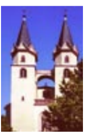
Hof, St. Michaelis

Hof (Ü, G, DB) – 3 – Osseck – 5,5 – Föhrenreuth (G) – 5,5 – Almbrenz – 4 – Günthersdorf/Edlendorf (Ü, G) – 4 – Helmbrechts (Ü, G, DB)