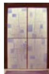
Kirchentür der Autobahnkirche Himmelkron

Markierung: Die Muschelmarkierung folgt ab der evang. Kirche dem Schiefe Ebene-Lehrpfad (SE), dann dem Mainwanderweg (blaues M) bis nach Himmelkron und ab Lanzendorf dem Nortwaldweg (blaues N) des Frankenwaldvereins. Wir beginnen an der kath. Jakobuskirche und gehen über den Marktplatz und rechts ab in den Pulster Weg. An der evang. Kirche vorbei geht es im Pulstbachtal abwärts nach Himmelkron. Die Stiftskirche (13. Jh., Kloster um 1600 bis zur Säkularisation, Pilgerstempel) und das Stiftskirchenmuseum (bemalte Steinplatten