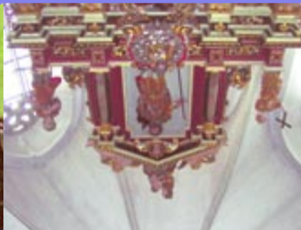
Jakobusfigur in Creußen