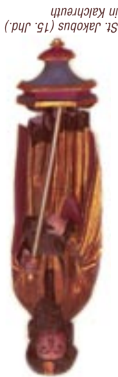
St. Jakobus (15. Jhd.) in Kalchreuth

Kalchreuth (Ü, G, DB) – 8 – Buchenbühl (G) – 8 – Nürnberg Altstadt (Ü, G) – 1 – Nürnberg St. Jakob (Ü, G, DB)