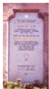
Hof, St. Marien Jakobustafel

Markierung: Die Muschelmarkierung durchquert die Stadt und folgt ab dem Stadtrand dem „Webersteig“ des Frankenwaldvereins (blauer Doppelstrich) bis zur Stadtkirche Helmbrechts. Durch den Landschaftspark Theresienstein kommend erreicht der Jakobusweg „Via Imperii“ Hof mit den Doppeltürmen der evang. Stadtkirche St. Michaelis (1230, Heidenreich-Orgel). In den naheliegenden Gebäuden der Diakonie (ehem. Klarissenkloster) ist seit 2012 eine Pilgerherberge eingerichtet. Weiter durch die von Jugendstil und Gründerzeit geprägte Innenstadt (Einkehr- und Einkaufsmöglichkeiten) führt der Weg zur kath. Marienkirche (1864) mit der Jakobusweg-Tafel (Architekt Hans Meyer, 1999). An dieser Stelle stand schon im Mittelalter das Pilgerhospiz „Zum Pilgrim“. Anschließend gelangt man zum Knotenpunkt der Wege an der St. Lorenzkirche (1214), der Keimzelle der Stadt Hof und Mutterkirche der Region. Hier mündet auch der Jakobsweg Vogtland. (Pilgerstempel in allen genannten Kirchen). Von hier aus erreicht man in einer dreiviertel Stunde den Stadtrand. Durch das Dörfchen Osseck hindurch und am Rand des Flughafens Hof vorbei geht es über Föhrenreuth und Almbrenz zum höchsten Punkt der