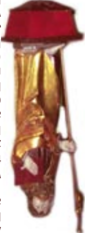
St. Jakobus (14. Jhd.) in Marktschorgast