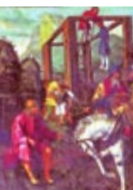
„Hühnerwunder“ in Neudrossenfeld

Der Weg orientiert sich in seinem Verlauf an der historischen Handelsstraße Ostsee-Leipzig-Nürnberg-Adria (ehemalige „Via Imperii“ und heutige B 2). Aus regionalen Erwägungen führt er jedoch nicht über Münchberg und Bad Berneck, sondern über Helmbrechts und Marktschorgast. Weiter über Bayreuth, Creußen, Pegnitz, Betzenstein und Gräfenberg überquert er die Fränkische Alb und vereinigt sich vor Kalchreuth mit dem Jakobsweg Almerswind – Lichtenfels – Nürnberg.