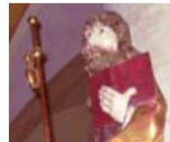
St. Jakobus in Marktschorgast