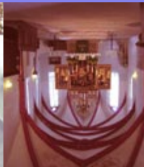
Lindenhart, St. Michael