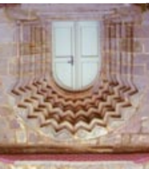
Kirche in Bronn, Portal