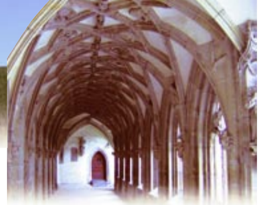
Kreuzgang in Himmelkron

von ca. 1490, u.a. mit Aposteldarstellungen, unter ihnen auch Jakobus d. Ä.) lohnen einen Besuch. Der Weg führt bewusst an der Autobahnkirche St. Christophorus (1998, Pilgerstempel) vorbei. Die Nachbildung des Labyrinths von Chartres auf dem Vorplatz ist ein Pilgerweg im Kleinen. Auf dem Höhenrücken hinter Lanzendorf lohnt der Ausblick zurück auf den Frankenwald und den Steilabfall der „Fränkischen Linie“ und auf die Gipfel des Fichtelgebirges. Hinter Ramsenthal überqueren wir den 50. Breitengrad und erreichen über Crottendorf (Einkehrmöglichkeit) und Schupfenschlag am Klinikum „Hohe Warte“ den Stadtrand Bayreuths. (Wenig später mündet der Anschluss von und nach Neudrossenfeld.) Der Weg führt an Festspielhaus (WC) und Bahnhof vorbei zum Anneckplatz (WC). Hier wird der Rotmainweg nach Creußen erreicht, dem der Jakobusweg später folgt.